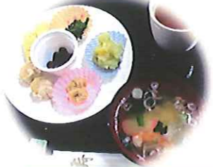
お雑煮とおせち料理