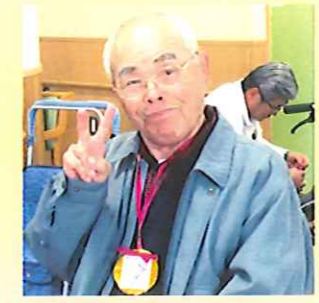
金メダルを買ったよ