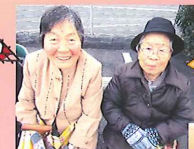
炭を付けてもらったよ!