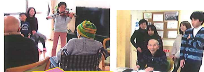
ひ孫さまのバイオリンの演奏

お正月には年末に皆さまでついたお餅をお雑煮で頂きました。ひ孫様の面会時にバイオリンの演奏のプレゼントや書初め・福笑いをして楽しみました。面会や外出・外泊のご協力ありがとうございました。