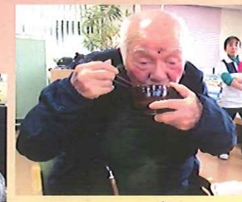
ぜんざいは美味しい〜