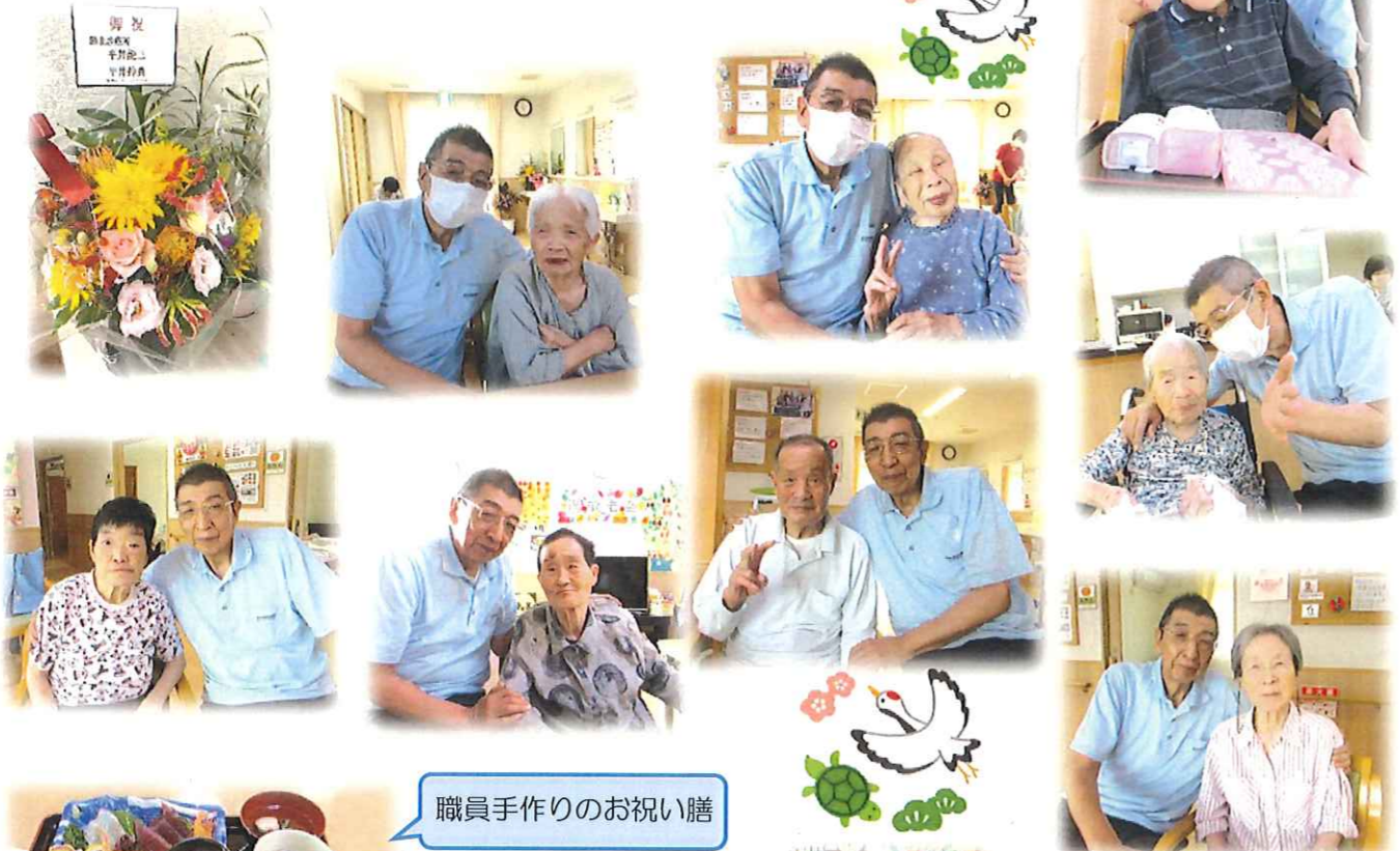
職員手作りのお祝い膳

9月15日(日) ささやかですが、グループホームで敬老のお祝いを させていただきました。理事長からお祝いの言葉を 頂き、一緒に写真を撮りました。